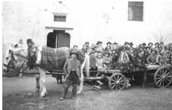
Kriegsmetall-Lieferung Göstling 1917. Abschied der Wandlung- und Zügelglocke.