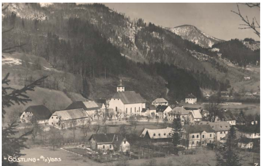
Göstling in den dreißiger Jahren

26.10.1935: Obstschau im Saale FRÜHWALD (Gasthaus zum Brauhaus). 580 Gruppen mit herrlichem Obst, da es ein gutes Obstjahr war.