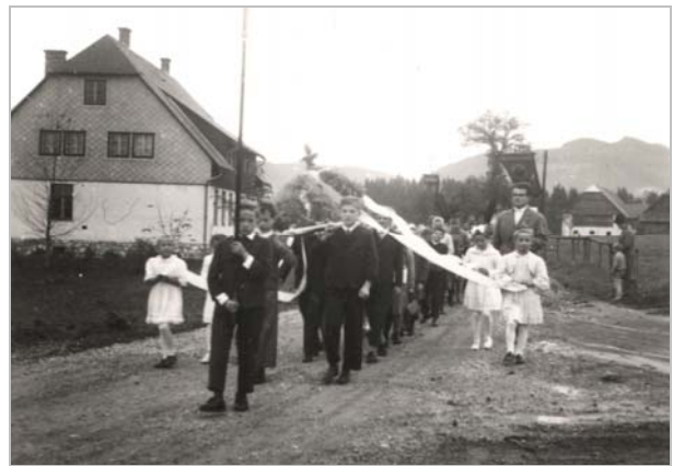
Lassinger Schüler beim Erntedankfest im Oktober 1961

23. Juli 1961: Die Hochkar-Schutzhütte (Kremserhütte) erhält eine Wasserleitung und die Gemeinde beteiligt sich mit einem Interessenten-Beitrag von S 6.000,- (Weidegenossenschaft).