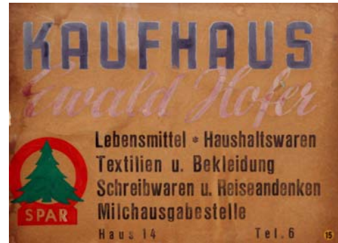
Werbetafel Kaufhaus Hofer, Mitte der Sechziger.

Im SPORT gibt's auch einiges zu vermelden: